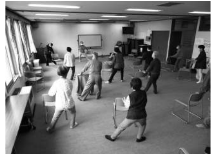
楽しい脳活ゲーム等を行っています！

会 場：芦野会館(芦野 3-29-5) 開催日：毎週金曜 10:00~12:00 内 容：茶話・介護予防運動・脳活ゲームなど 実 費：なし