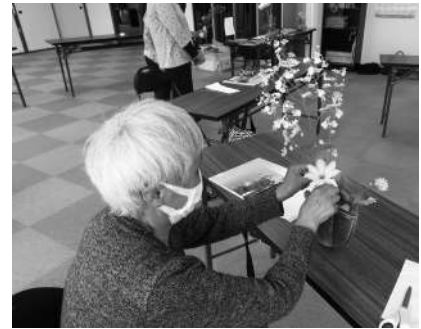
花器づくりや一輪花を楽しみます！

会 場：愛国東会館(愛国東 2-1-15) 開催日：毎週月曜 10:00~11:30 内 容：茶話・軽体操・季節のイベントなど 実 費：材料費 300円/回