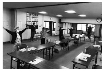
楽しみながら、体操を行っています！

会 場：まなざしの和(美原 1-31-1) 開催日：毎週土曜 10:30~13:00 内 容：軽体操・脳活性化トレーニング・食事など 実 費：食事代 400円/回・教材費 500円/年 ※新型コロナウイルスの感染予防に伴い、 現在は、会場が美原地区会館へ変更され、 開催日が毎週土曜 10:00~11:30、 食事の提供は無く、実費はありません。